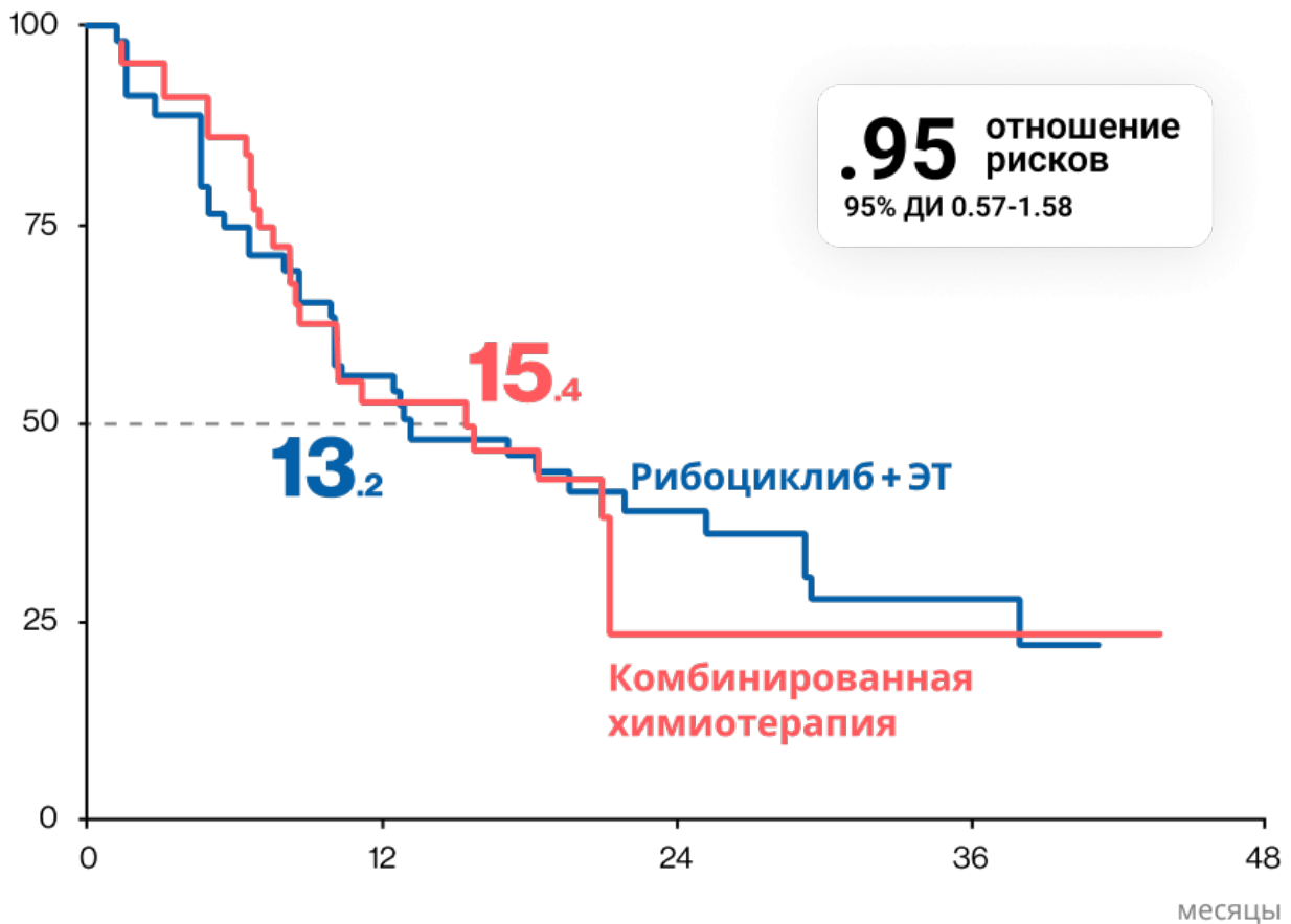
Рисунок 1. Выживаемость без прогрессирования у пациентов с висцеральным кризом