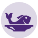
Треска без кляра