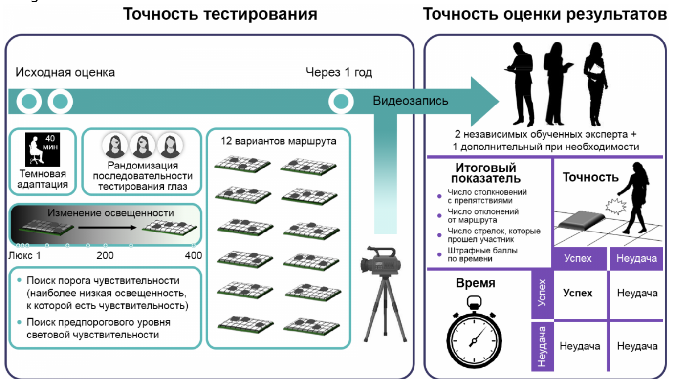
Рисунок 3. Процедура и оценка результатов MLMT