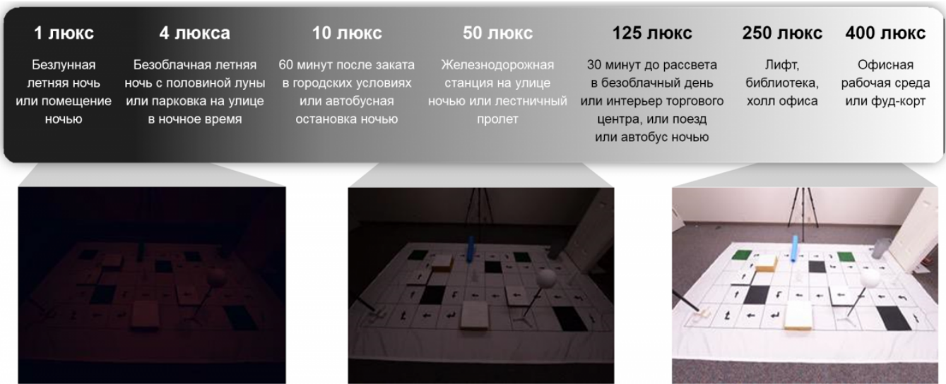
Рисунок 2. Примеры уровней освещенности

Как проводить процедуру и оценивать результаты MLMT показано на рисунке 3.