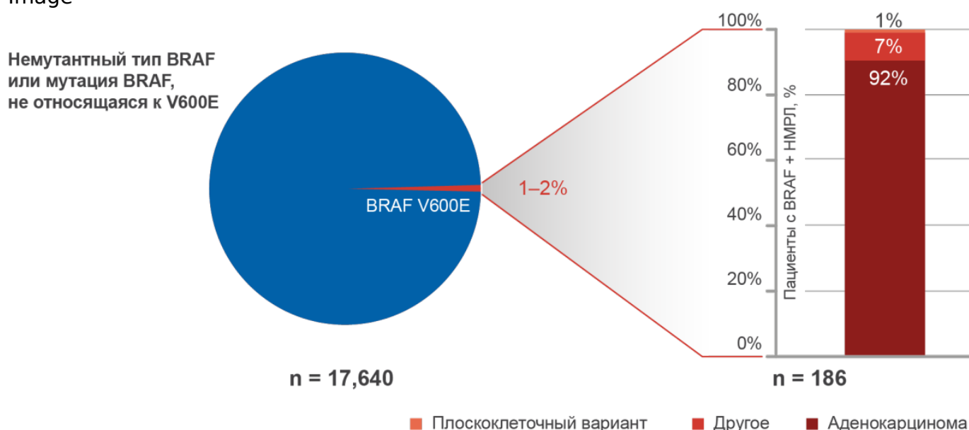
Рисунок 1. Частота выявления мутации в гене BRAF в зависимости от гистологического варианта НМРЛ

Они могут возникать либо в положении V600 экзона 15, как в меланоме, либо вне этого домена, и обычно выявляются с помощью ПЦР или методов NGS. Для пациентов с НМРЛ с мутациями BRAF V600E, у которых выявлен прогресс опухоли на химиотерапии, а также при отсутствии предшествующей терапии, может быть назначена комбинация дабрафениба и траметиниба, получившая одобрение для клинического применения.