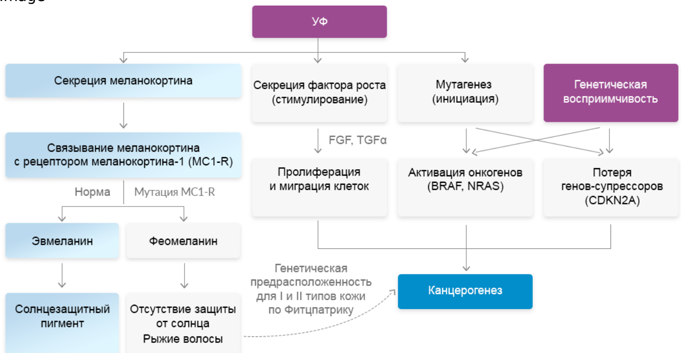
Рисунок 1. Патогенез меланомы