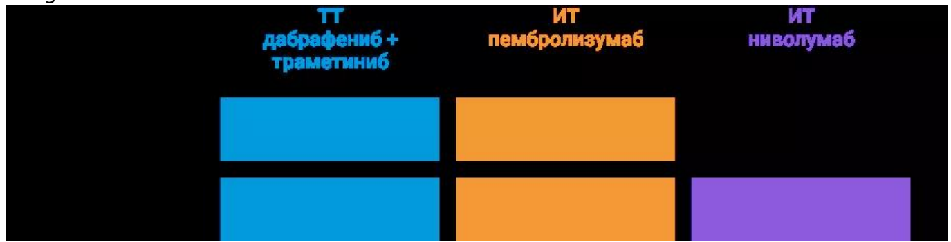
Рисунок 1. Опции АТ после удаления меланомы кожи III стадии.

Как же определить, какая АТ будет оптимальна в каждом конкретном случае и от чего это зависит? В настоящее время нет данных прямых сравнительных клинических исследований различных опций АТ после резекции меланомы кожи III стадии. Но мы можем самостоятельно провести не прямое сравнение результатов ключевых клинических исследований трех вариантов АТ: