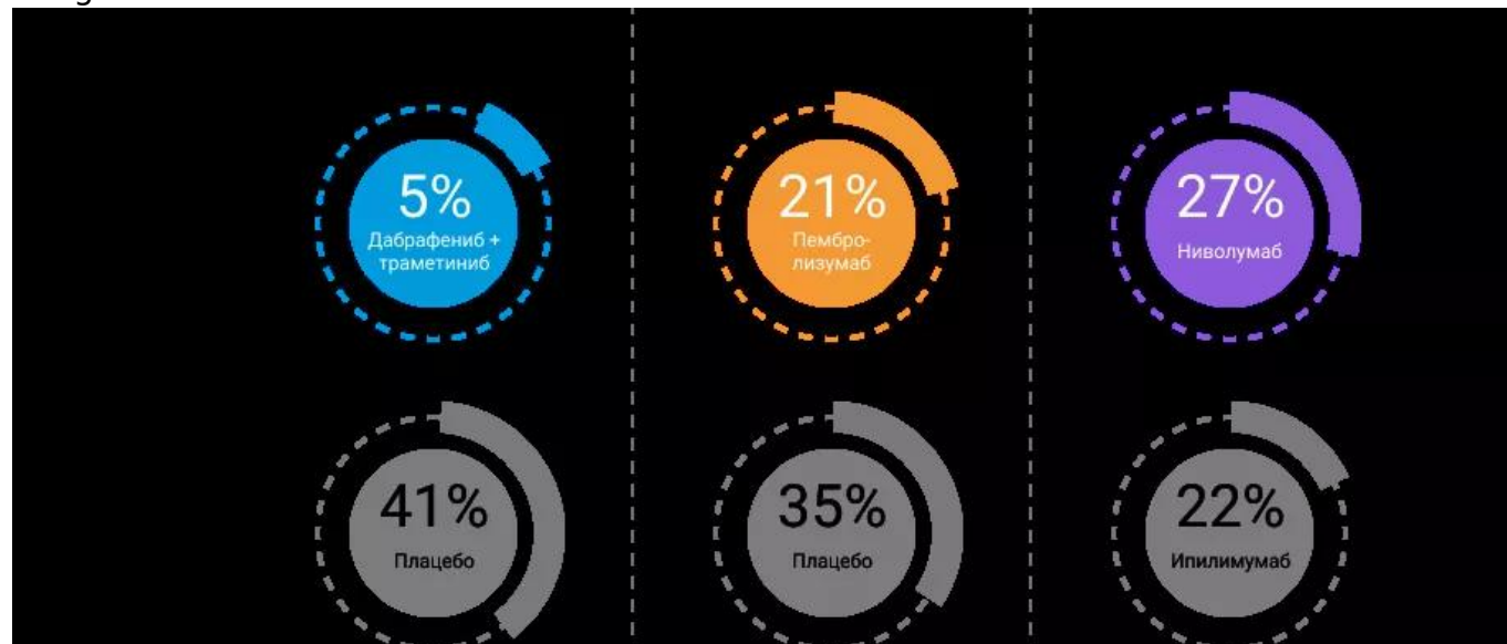
Рисунок 2. Досрочное завершение лечения из-за рецидива меланомы кожи.

Последующее наблюдение за пациентами в обсуждаемых клинических исследованиях подтвердило, что проведение АТ снижает риск развития как локорегионарных, так и отдаленных метастазов меланомы кожи. При непрямом сравнении показатели эффективности ТТ были выше аналогичных показателей ИТ 2–8 .