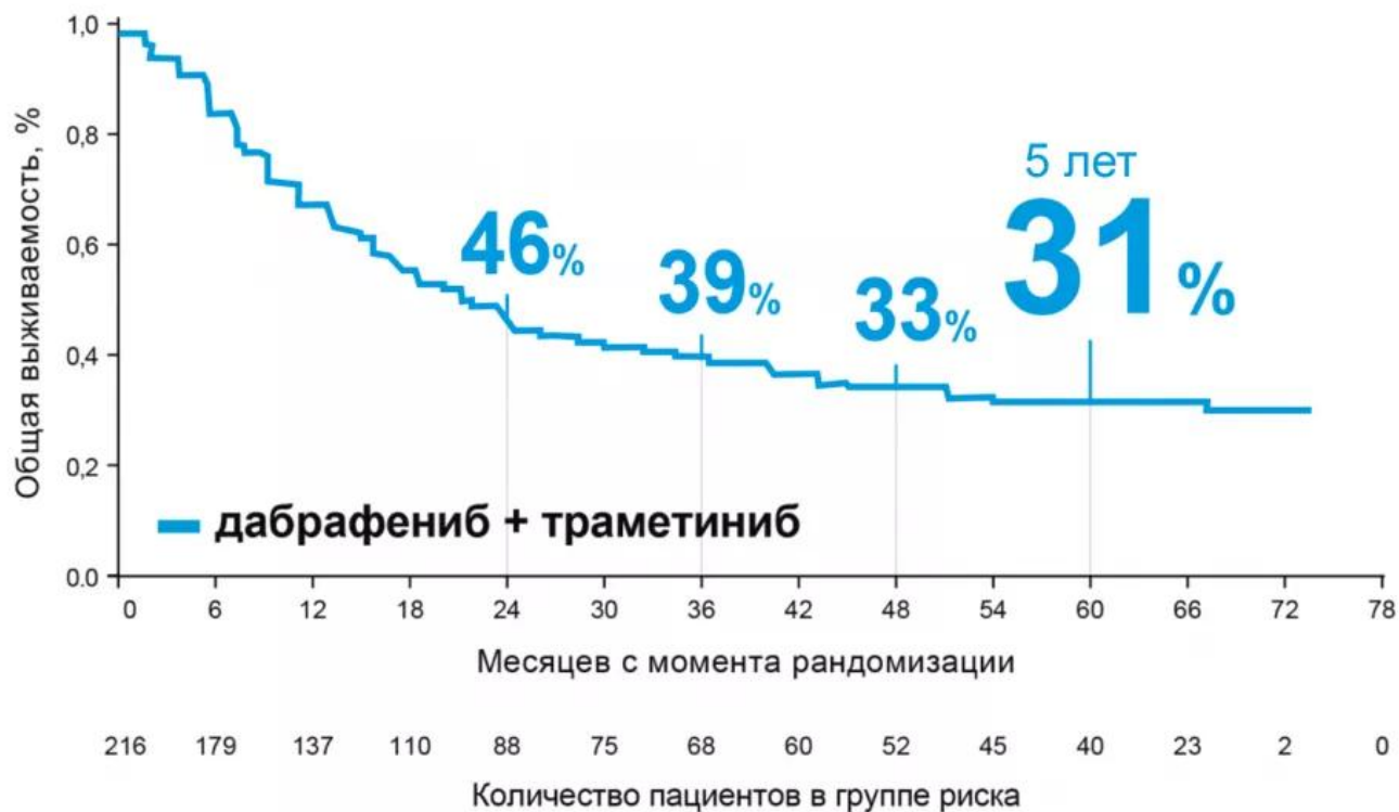
Рисунок 3. Динамика выживаемости без прогрессирования (исследования COMBI-d и COMBI-v, участники с клиническими характеристиками благоприятного прогноза)