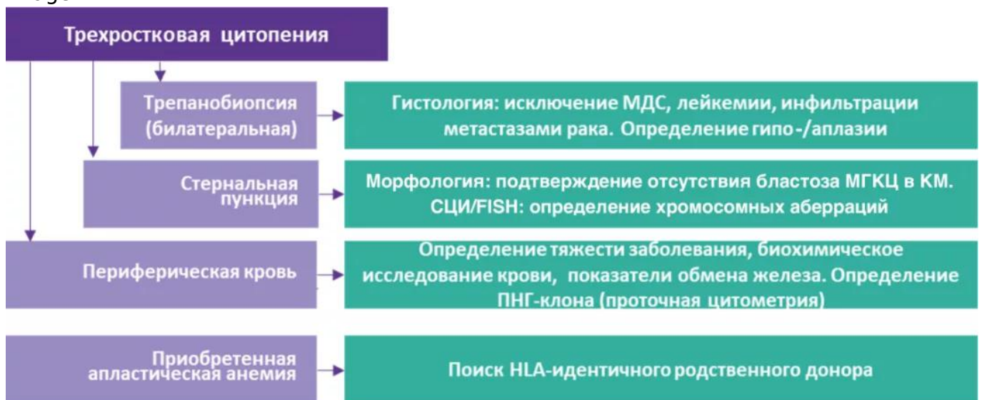
Рисунок 1. Алгоритм диагностики АА

Диагноз АА ставится методом исключения, таким образом, особое внимание следует уделить дифференциальной диагностике АА 7 . В ходе диагностики необходимо подтвердить диагноз и исключить возможные причины панцитопении и гипоцеллюлярного костного мозга, включая поздние проявления врожденных синдромов недостаточности костного мозга. На данный момент отсутствует единый метод, который позволил бы надежно установить диагноз приобретенной (идиопатической) АА 1 .