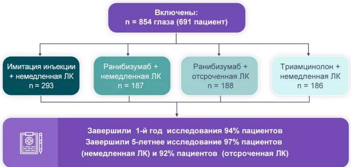
Рисунок 1. Дизайн исследования PROTOCOL I