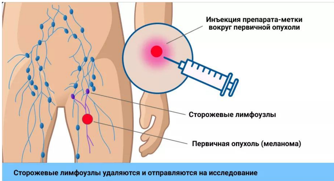
Рисунок 2. Методика проведения БСЛУ.