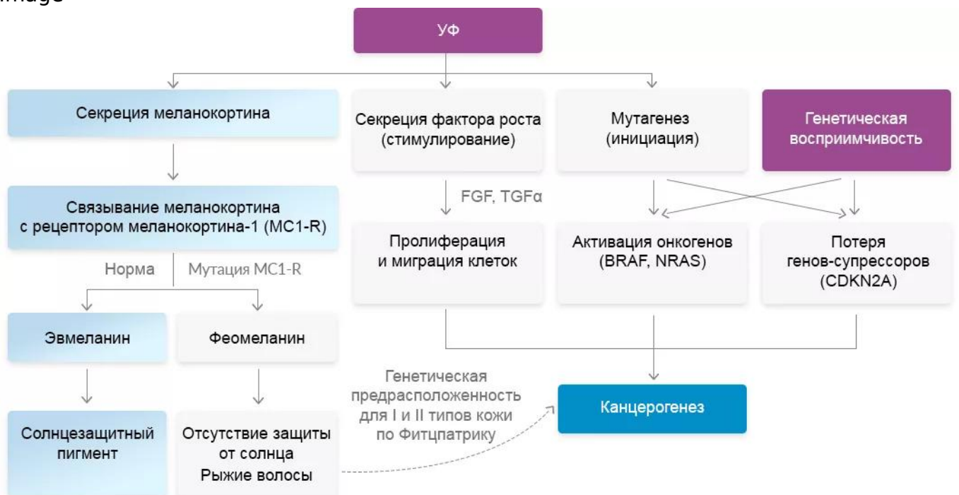
Рисунок 1. Патогенез меланомы